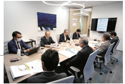
最終審査会にて入賞作品を選定