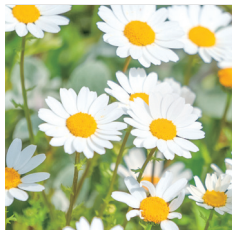
ノースポール キク科 フランスギク属