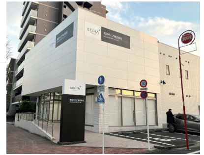
地域に密着したサービスをお届けしてまいります

本件についてのお問い合わせは、 [総務ユニット 総務グループ]まで。 TEL.03-6478-1331