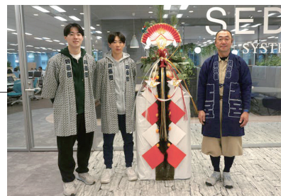
エントランスには立派な御正月飾りが設置されました

本年も変わらぬご支援とご協力を賜りますようお願い申し上げます。社員一同、新たな挑戦に向けて決意を新たに、全力で取り組んでまいります。