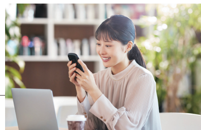
社員の健康を第一に快適な職場環境を実現します

今回のオンライン診療サービス導入は、「渡辺パイプ株式会社」と「渡辺パイプ健康保険組合」が行うコラボヘルスの一環です。コラボヘルスとは、企業と健康保険組合が協力して、社員の健康をサポートする取り組みです。今後も、会社による「健康経営の推進」と健康保険組合による「保険者機能の発揮」を同時に実現し、セディアグループ全体の活力向上と成長のため、働きやすい職場環境整備に取り組みます。