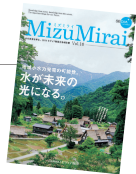
「水が未来の光になる。」をテーマにレポート

また、セディア財団が主催している全国の農業を学ぶ高校生を対象とした「高校生が描く『明日の農業コンテスト』」や、小学生対象の「全国小学生『わたしたちのくらしと水』かべ新聞コンテスト」、小中高生対象の「生きもの写真リトルリーグ」の活動についても掲載しています。今号の特集ページをセディア財団WEBサイトにて公開しておりますので、ぜひご覧ください。