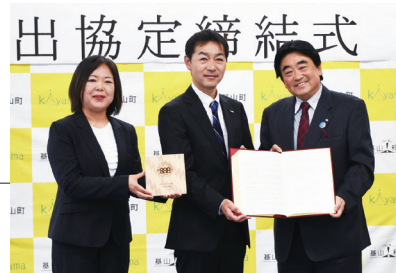
新鮮ないちごをお届けする新たな農園が誕生します

現在、げんき農場は埼玉県羽生市と千葉県八街市に農園を構え、いちごとミニトマトを栽培しています。3カ所目となる基山農場では、いちご栽培事業のほか、いちご狩り体験や直売所での販売を行う予定です。さらに、将来的には、ふるさと納税の返礼品としての販売も検討します。