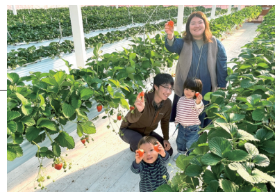
5品種の食べ比べが楽しめるいちご狩り体験がスタート

https://www.sedia-green.co.jp/farm/index_s.html