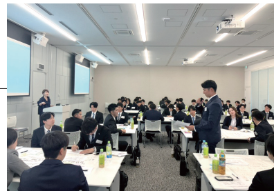
成長を続ける新入社員にご期待ください

この研修を通して、社会人2年目に向けて必要な知識や行動、考え方について理解を深めることができました。成長を続ける新入社員たちを、どうぞよろしくお願いたします。