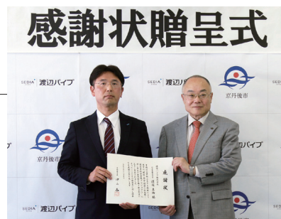
京丹後市役所での贈呈式の様子

渡辺パイプは、企業版ふるさと納税制度(地方創生応援税制)を通じて、2024年12月に京都府京丹後市の「環境・社会・経済の好循環! 脱炭素社会実現プロジェクト」に対して、現金寄附のほか、電気自動車用急速充電器の物品も寄附しました。