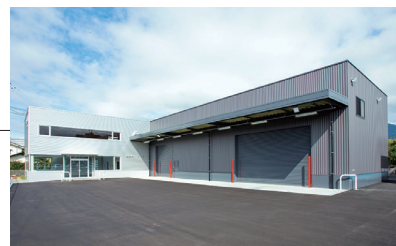
10月に開設した上田サービスセンター