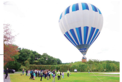
自然への関心を高めていただくことを目指しています

これらの活動を通して、ご来場いただいた皆さまが自然とふれあい、自然への関心を高めていただくことを目指しています。春シーズンからは企業研修といったレクリエーションなどの活用や団体利用も受け付けています。ぜひお気軽にお問い合わせください。