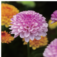
ポットマム キク科 クリサンセマム属