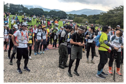
544名もの皆さまにご参加いただきました

来年も開催予定のため、浅間山麓の雄大な自然を体験してみたいという方はぜひご参加ください。