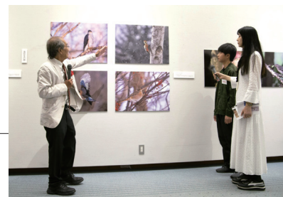
プロの写真家から講評をいただきました

●公益財団法人 セディア財団WEBサイト／ https://www.sedia-found.org/