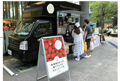
げんき農場のキッチンカーが精力的にイベントに出店