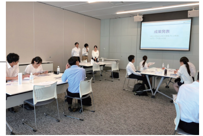
企業理解を深められるプログラムを実施

渡辺パイプに興味を持っていただいた学生の方々に、セディアグループへの理解をより深めていただけるよう、今後も様々なインターンシップを開催してまいります。