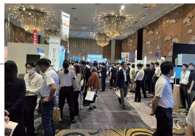
展示ブースでは商談や質問が活発に交わされていました

今後もお客さまや仕入先さまとダイレクトにつながり、共に建設業界を活性化する取り組みを行ってまいります。